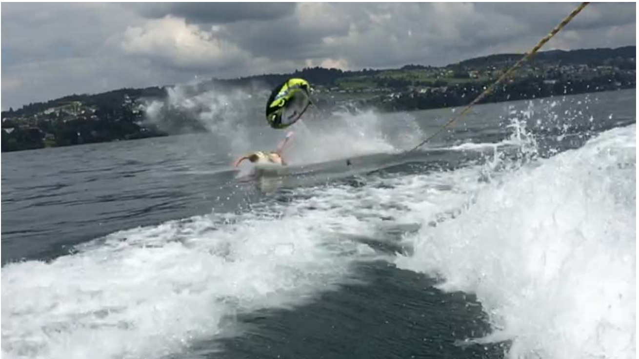
Hihihhi.... Note 8, Landung könnte besser sein ☺