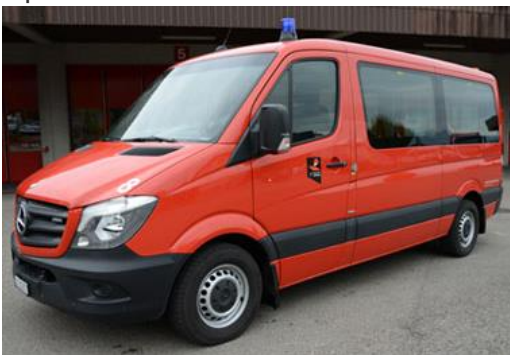
Sprinter BT 4x2 Automat MTF 2016