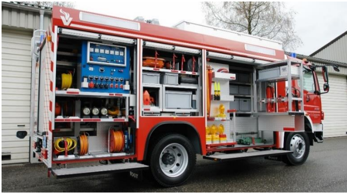
Mercedes Benz Atego 1428 AF/36 Pionierfahrzeug Stützpunkt