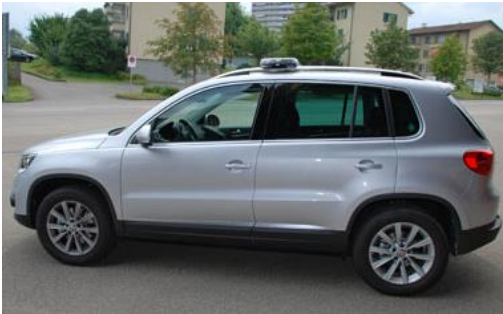
VW Tiguan 4motion KdoFz 2012