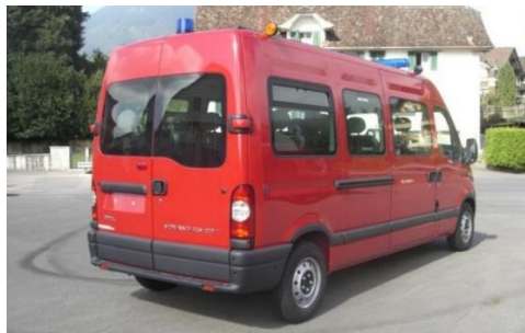
Opel Movano 25 TD N39/40