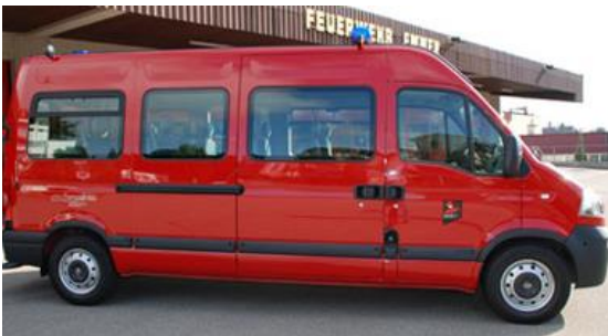
Opel Movano 25 TD N39/40