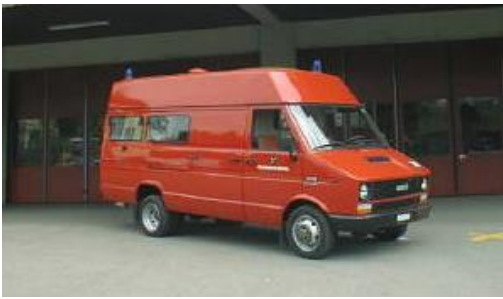
Iveco TurboDaily 35-10 MTF 1987