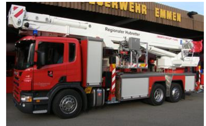
Scania P420 LB 6x2*4 Regionaler Hubretter Bronto Skylift F38RL