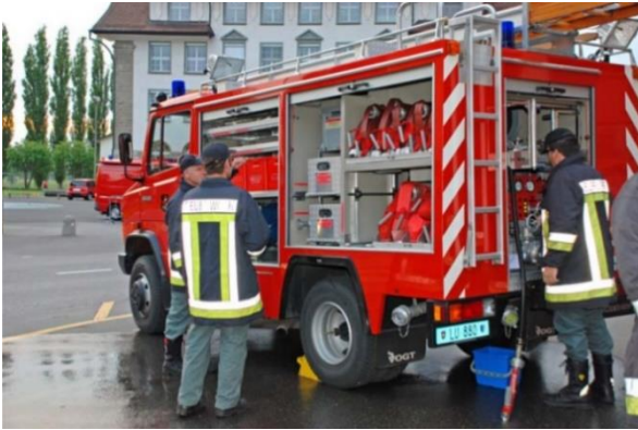
MB T2 814 DA TLF Raubritter