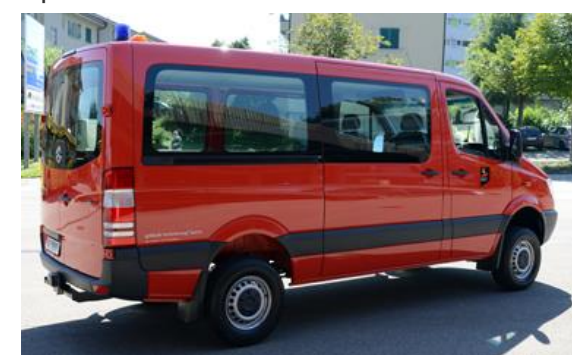
Sprinter 316 CDI 4x4 MTF 2013 FW Emmen