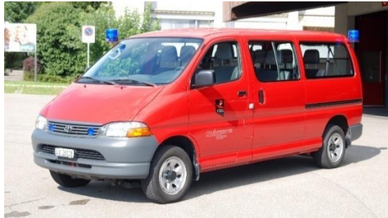
Toyota Hiace 4WD MTF ZS+