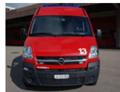
Opel Movano 25 TD N39/40