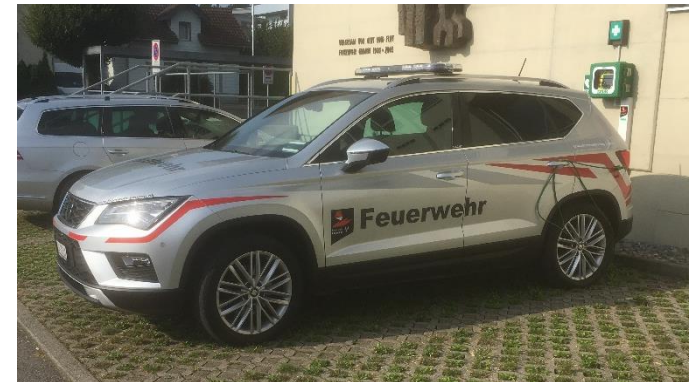
Ateca TDI 2017 Pikett Nacht