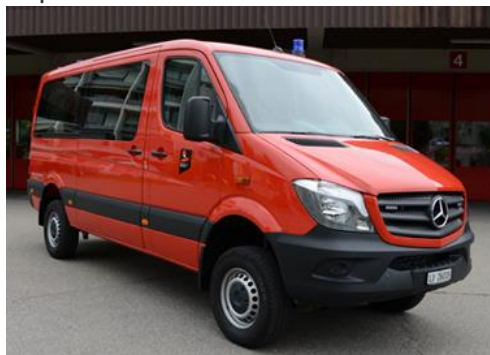
Sprinter 316 CDI 4x4 MTF 2017