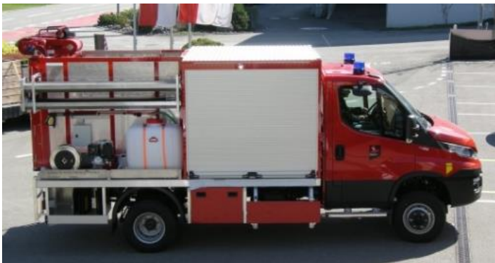
Iveco Daily VI 72C17 Schlauchverlegefahrzeug Brändle