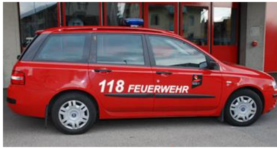
Fiat Tempra Kdt-Fz