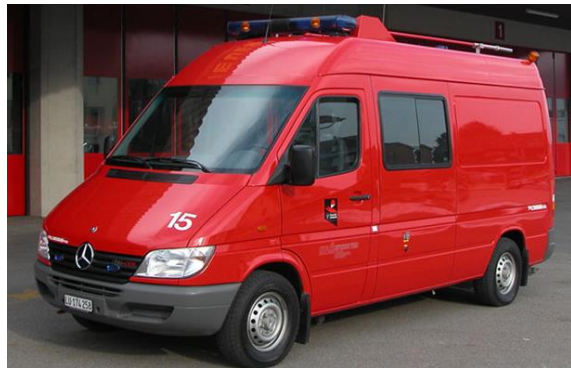
Sprinter 316 CDI ELF 2002