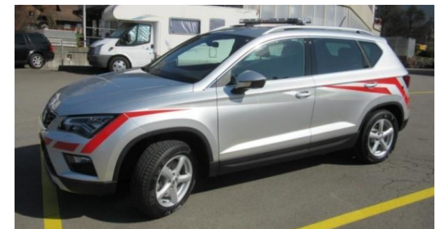
Seat Ateca TDI 2017 FW Emmen (Rüegg)